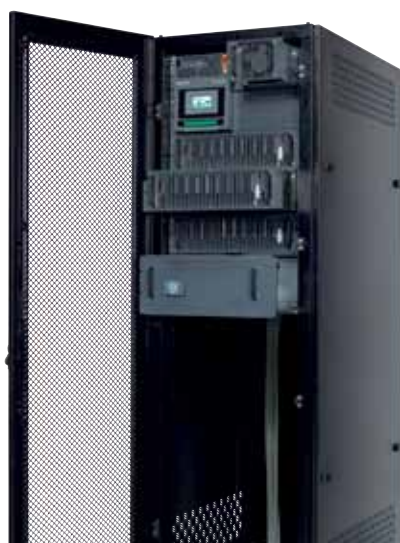
Módulos de potencia intercambiables en caliente, bypass y baterías en un sistema sin electrónica: sin ningún punto de fallo y mantenimiento sin riesgos.

50 años de experiencia como fabricante en Alimentación crítica