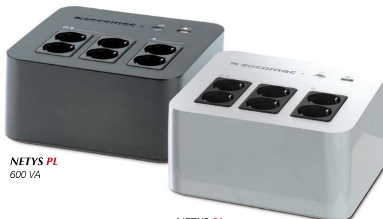
NETYS PL 600 VA

Protection multiprise, pratique 600 et 800 VA