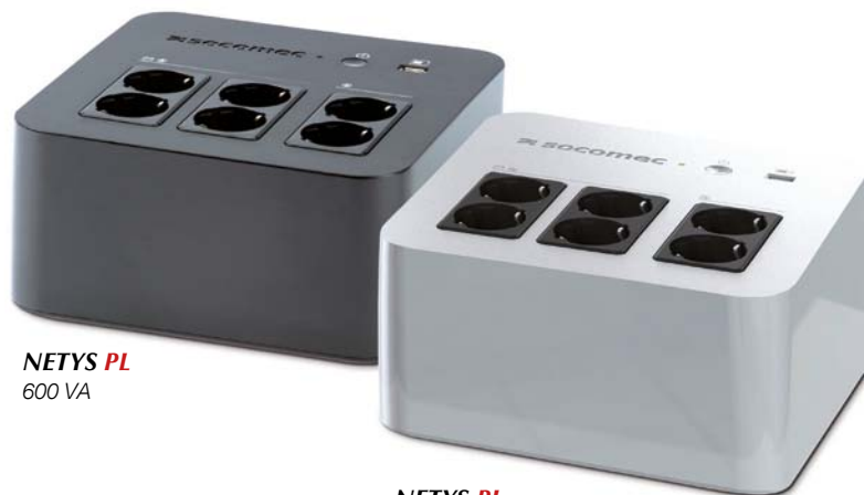
NETYS PL 600 VA